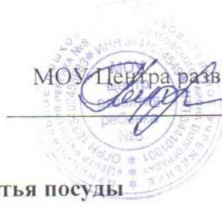
График мытья посуды по возрастным группам МОУ Центра развития ребенка № 8 на 2023 год.